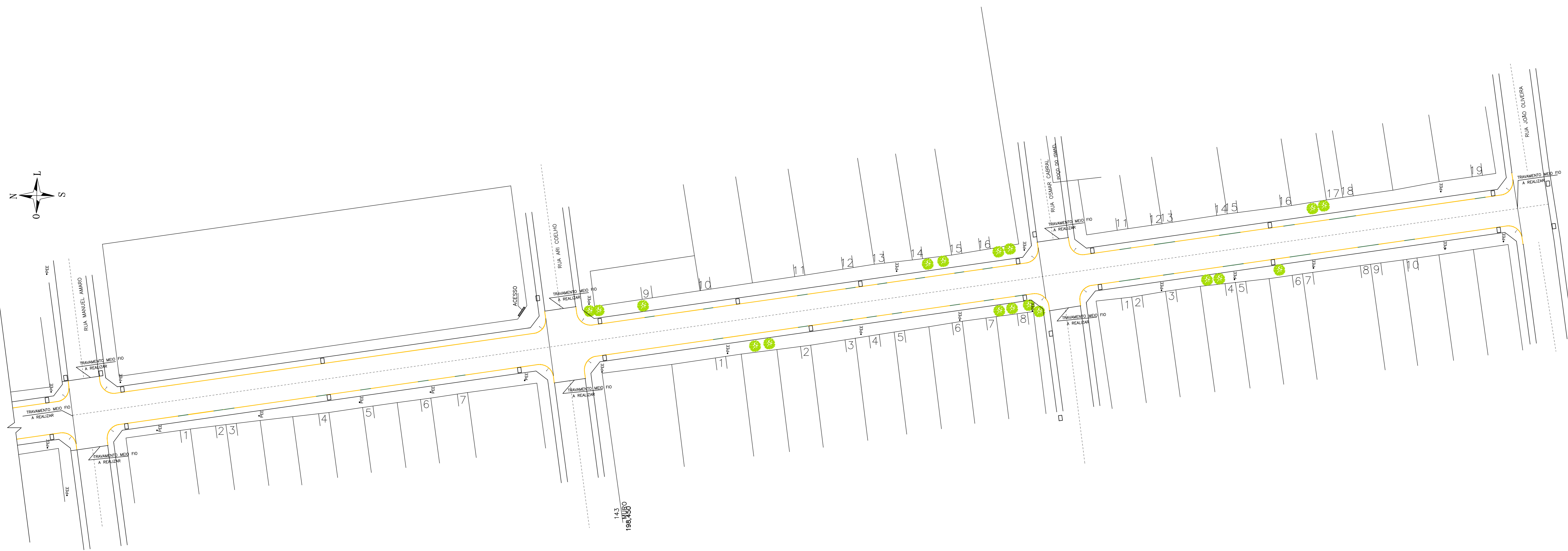
PLANTA BAIXA – GARAGENS

■ ENTRADA DE GARAGEM (MEIO FIO REBAIXADO)