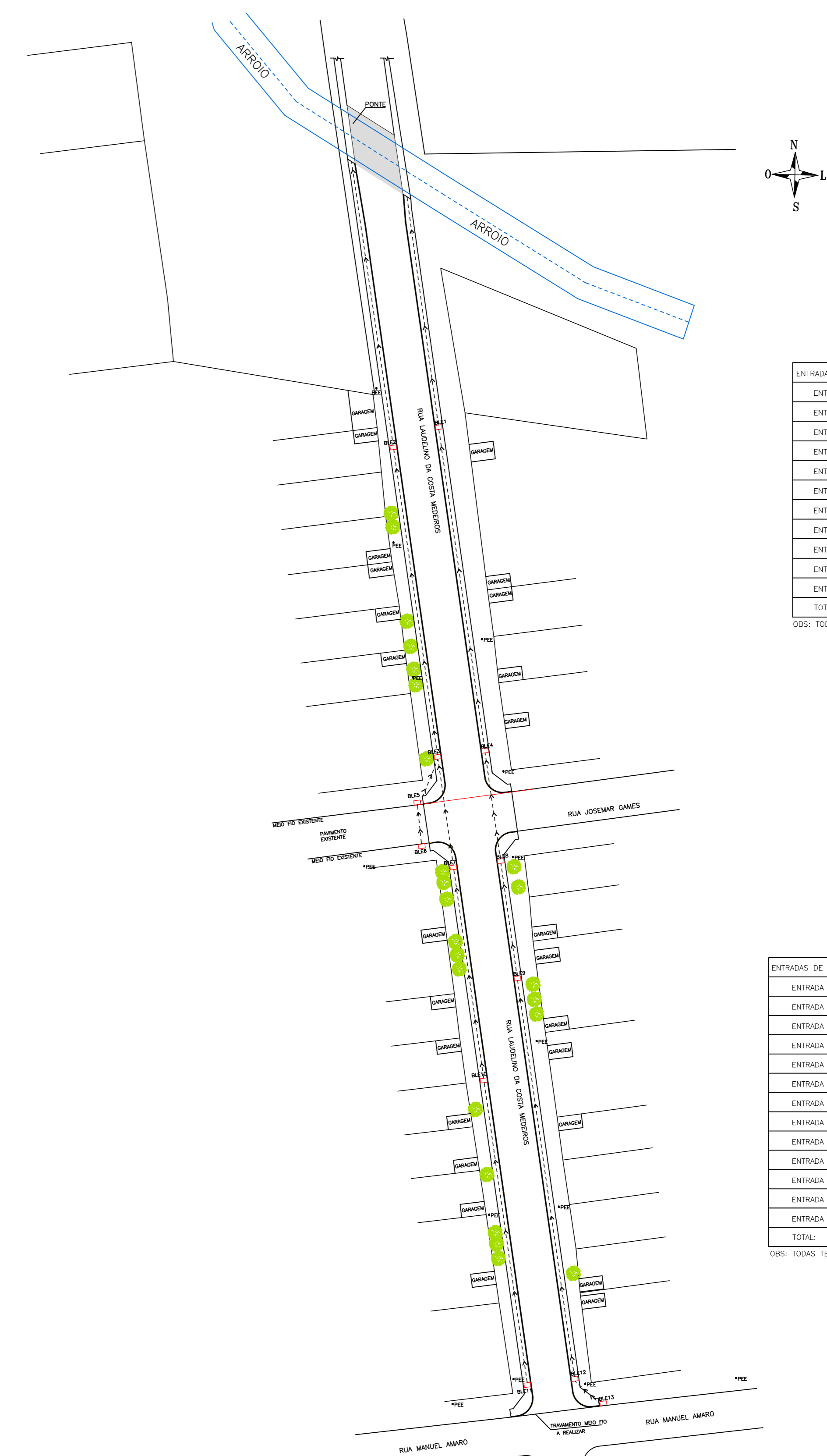
REDE DE DRENAGEM EXISTENTE

ÁREA A SER PAVIMENTADA E MEIO FIO QUADRA A: 1.294,92m 2 QUADRA A: 290,16m 2 QUADRA B: 1.376,54m 2 QUADRA B: 303,88m 2