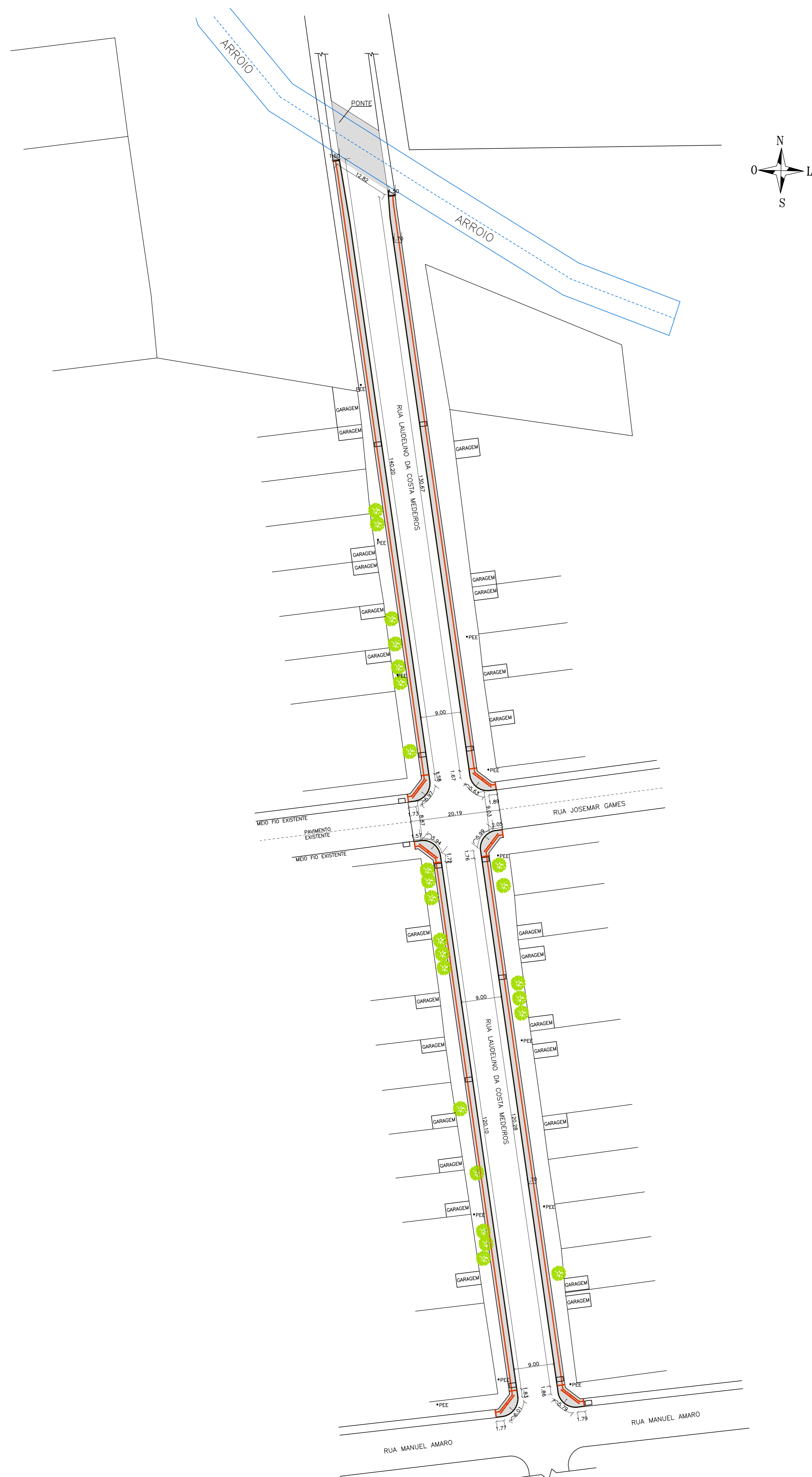
PLANTA BAIXA – COTAS