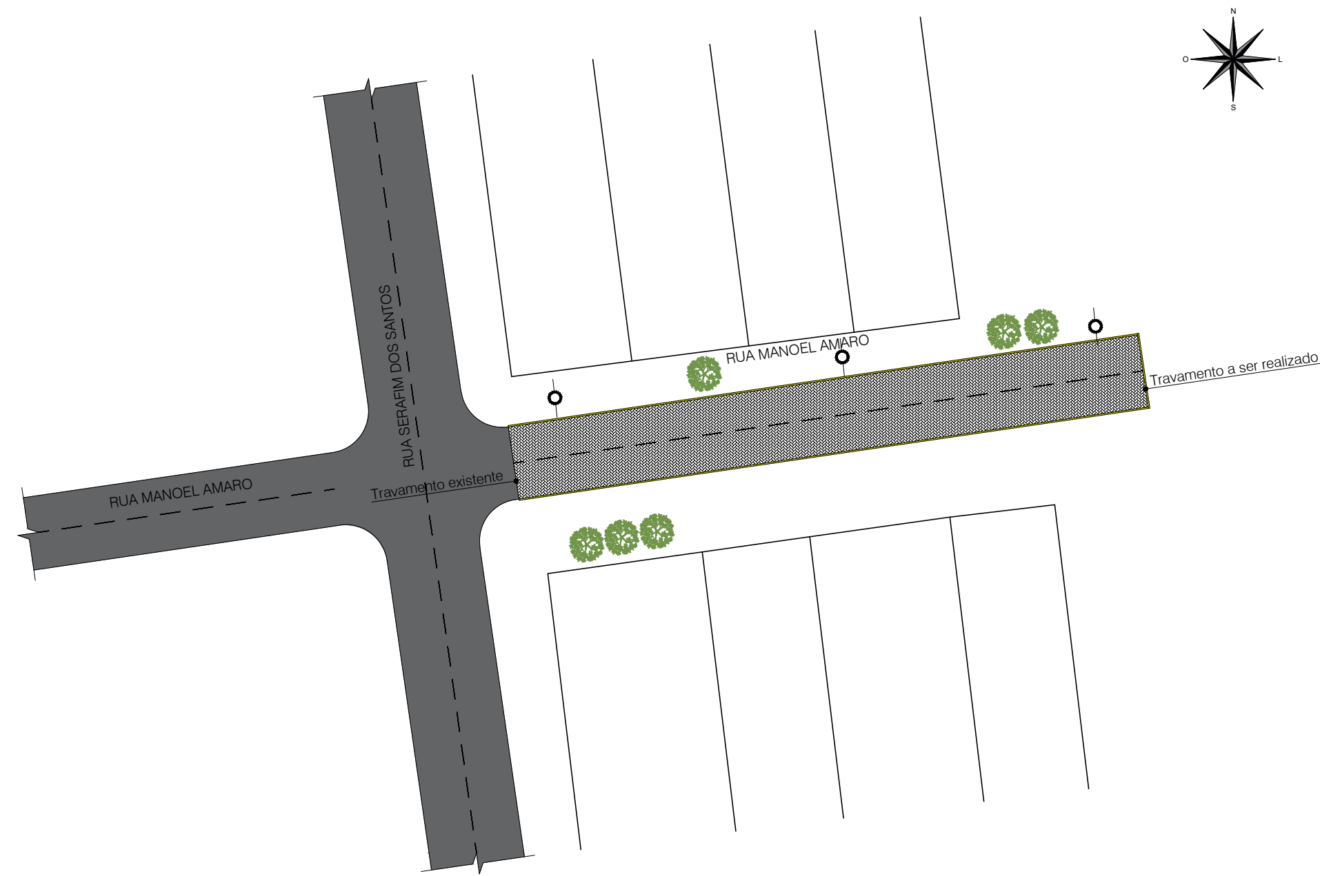
02 PLANTA BAIXA - PAVIMENTO ESC.: 1/500

QUADRA C *PAVIMENTO: 427,00m² *MEIO-FIO: 129,00m