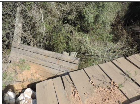
Figura 8. Travessia 2 em afluente do Rio Jaguarão