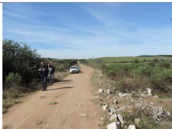
Figura 7. Estrada do Seival (antiga Estrada Bagé - Pelotas), vista para leste