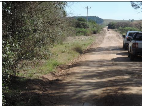
Figura 5. Estrada do Seival (antiga Estrada Bagé - Pelotas),