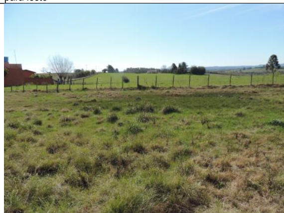
Figura 9. Local requerido para construção da ETA