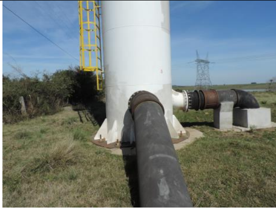
Figura 2. Captação utilizada pela termoelétrica