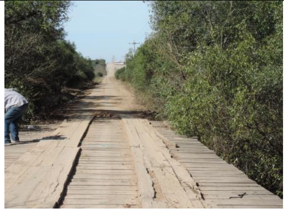
Figura 3. Travessia no Rio Jaguarão (divisa entre Candiota e Hulha Negra)