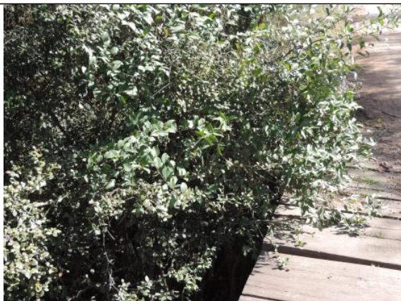
Figura 4. Travessia 1 no Rio Jaguarão (divisa entre Candiota e Hulha Negra) – detalhe da cobertura vegetal