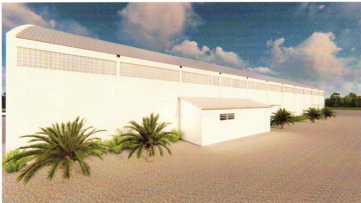
Vista leste – alvenaria de vedação cobogó

Deverá ser retirada as janelas pelo lado leste do ginásio e instalar alvenaria de vedação com elemento vazado de cerâmica (cobogó), no tamanho de 20x20 centímetros e espessura de 7 centímetros e argamassa de assentamento com preparo em betoneira.